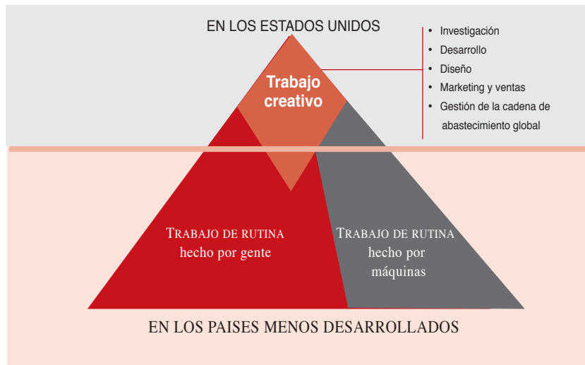
Figura 1 PROTOTIPO DE INDUSTRIA EN ESTADOS UNIDOS En 10 años si todo va bien